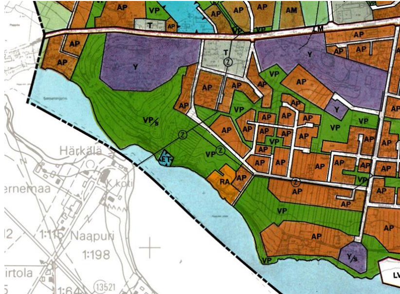
Ote valtuuston hyväksymästä osayleiskaavasta

Alueella on voimassa oikeusvaikutteeton 19.10. 1988 hyväksytty Someron taajaman osayleiskaava. Siinä alue on esitetty pääasiassa puistoalueena. Alueelta tehdään asemakaavoituksen yhteydessä yleiskaavallinen tarkastelu.