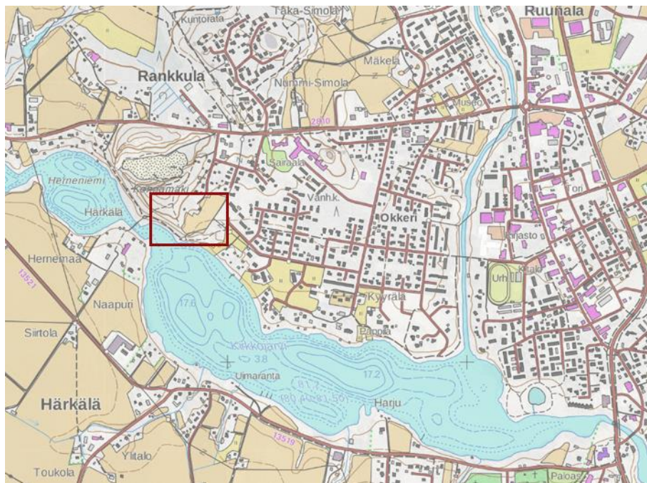
Suunnittelualueen sijainti maastokartalla (MML Lupanumero 790/KP/11)

Kaavoitus koskee pääosin rakentamatonta aluetta Valimotien päässä. Alue rajautuu Kirkkojärven rantaan ja pientaloalueisiin. Alueen luoteispuolella on maanottoalue.